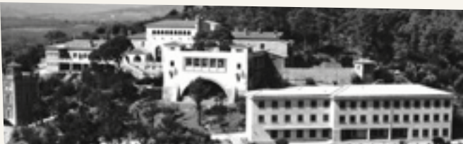
L'école des radiotélégraphistes avec l'Astrolabe vers 1960

Sur les hauteurs derrière le château Vernet, un bâtiment muni de meurtrières est construit dans les années 1930 par une société alsacienne aux activités mal définies. Sous couvert de productions cinématographiques, l' Astrolabe devait servir de base d'espionnage mais ses activités seront stoppées par les services de sécurité français. Après la Libération, La Marine Nationale y installe son premier centre de Formation Maritime dédié d'abord au canonage puis aux transmissions. En 1972, toutes les écoles de Marine étant regroupées à St Mandrier, l'école des radiotélégraphistes des Bormettes ferme. Le Ministère des PTT y ouvre un des premiers centres de formation national, l'Institut Régional d'Enseignement des Télécommunications, en activité jusqu'en 2001.